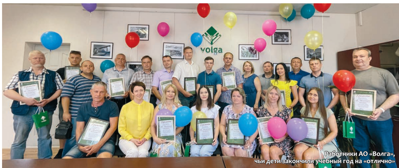
Работники АО «Волга», чьи дети закончили учебный год на «отлично»

Мы желаем успехов всем школьникам в предстоящем учебном году.