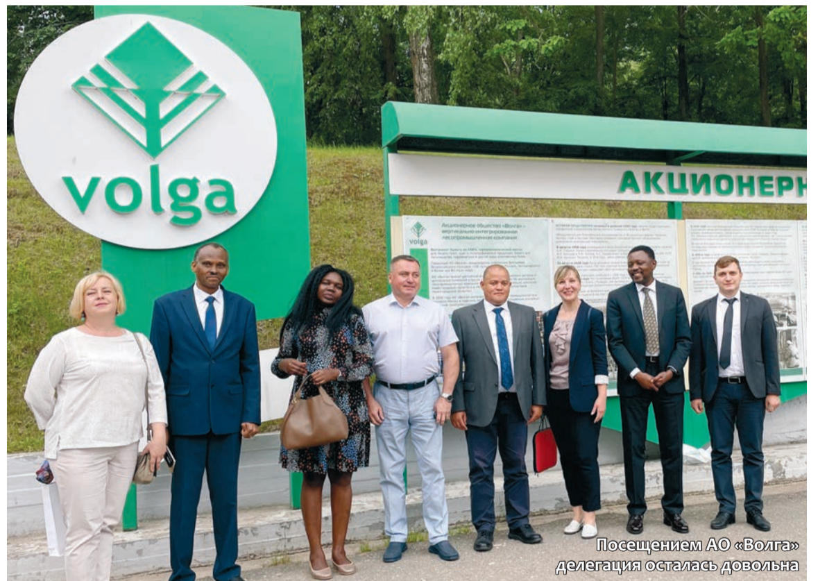
Посещением АО «Волга» делегация осталась довольна

21 июня по приглашению МИД по Нижегородской области и областного департамента внешних связей с рабочим визитом в наш регион впервые приехали представители посольства Республики Уганда (Восточная Африка) в Российской Федерации. Делегацию возглавил заместитель дипломатической миссии, временный поверенный в делах Гидеон Рутазиндва. В рамках визита гости побывали на бумкомбинате «Волга» в Балахне.