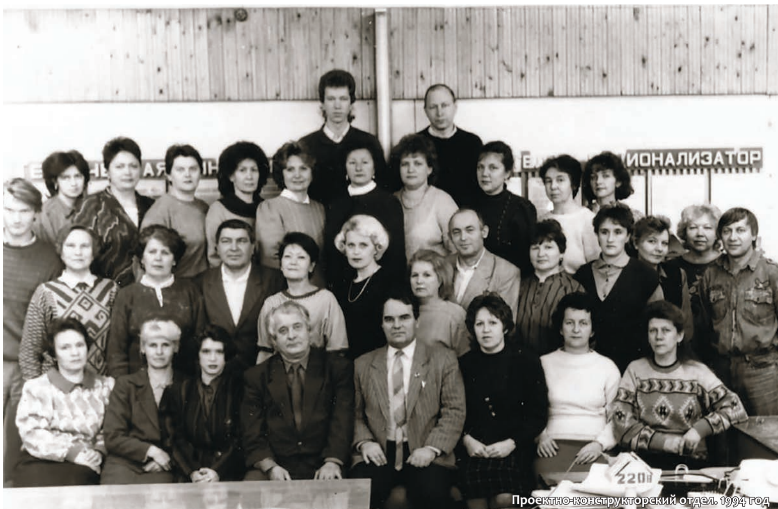
Проектно-конструкторский отдел 1994 год