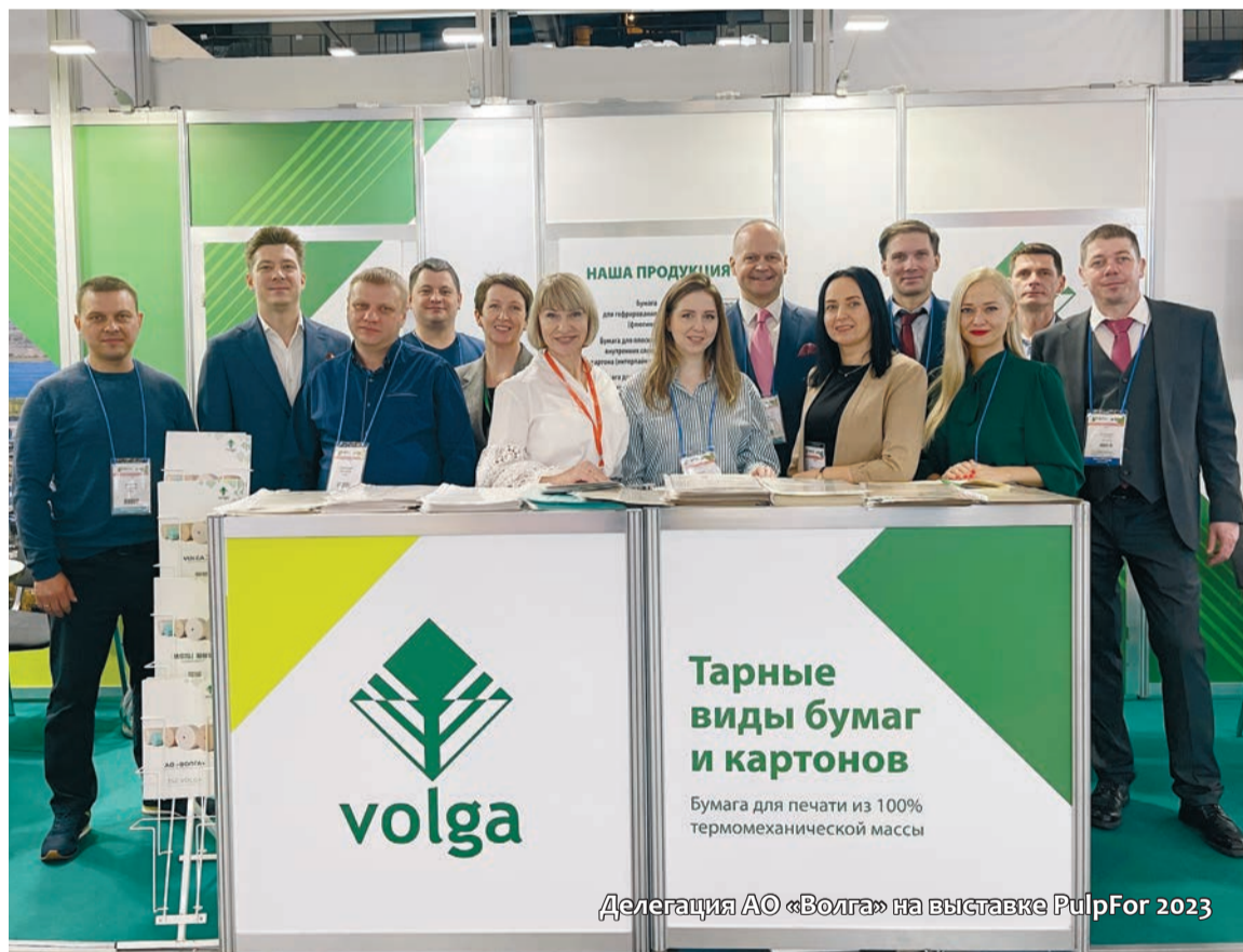
Делегация АО «Волга» на выставке PulpFor 2023