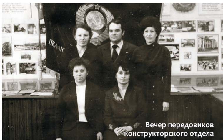
Вечер передовиков конструкторского отдела

– Во-первых, сплоченного коллектива. Благодаря этому можно достичь больших высот в производстве. Во-вторых, постоянно повышать знания в сфере своей работы. В свое время я перечитал всю доступную литературу по своей специальности. Теория без практики и практика без теории – не работает. В-третьих, повышать производительность труда. Благодаря этому руководство будет понимать, насколько важна ваша работа.