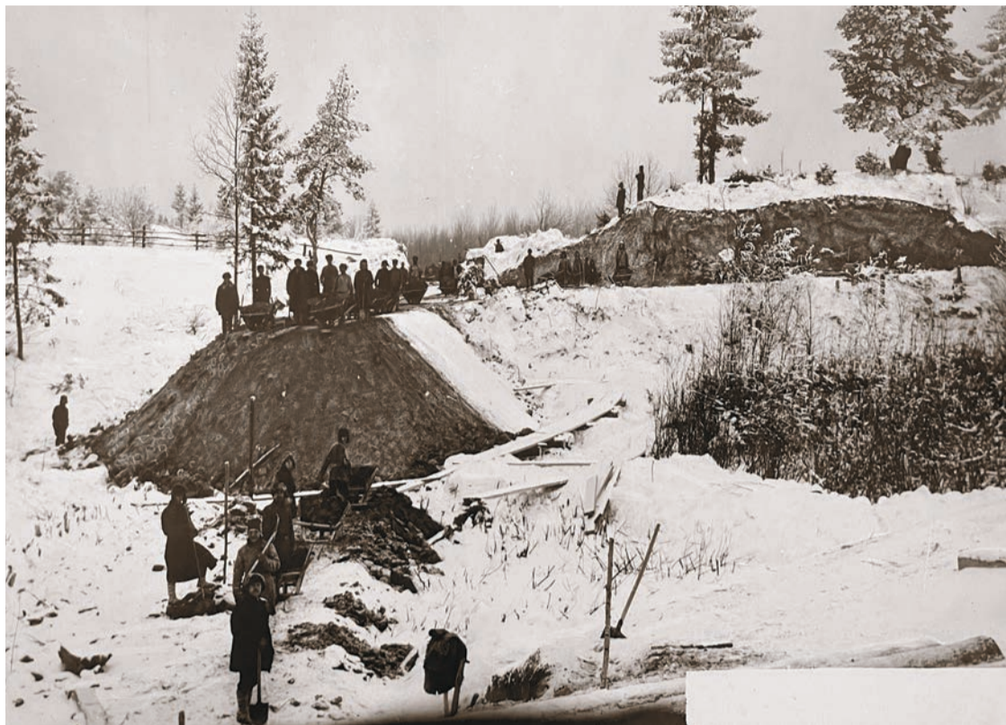
На этой фотографии запечатлен процесс укладки первой железнодорожной ветки до Балахнинского бумкомбината. Январь 1926 года.