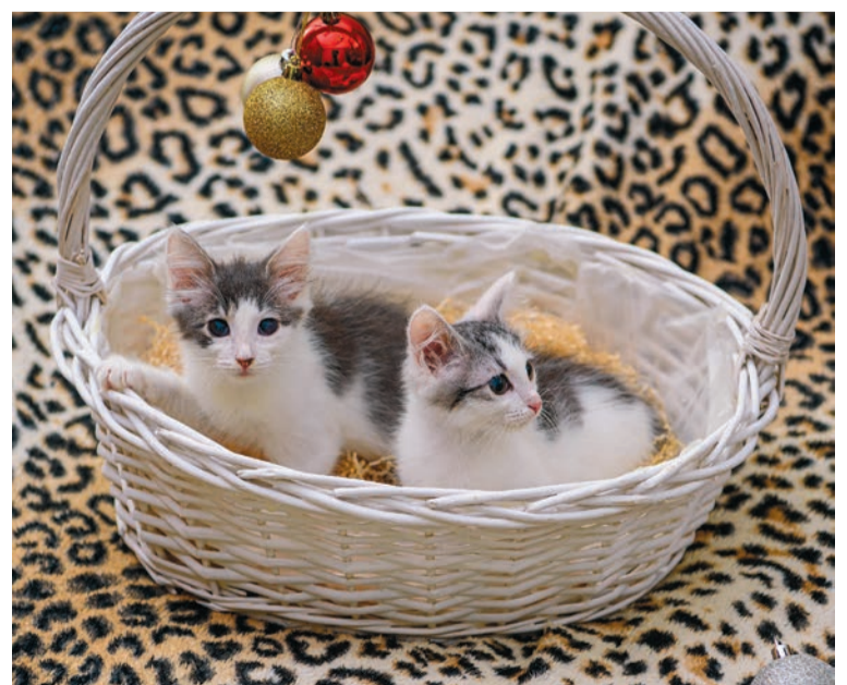
Эти «хвостики» ищут свой дом!