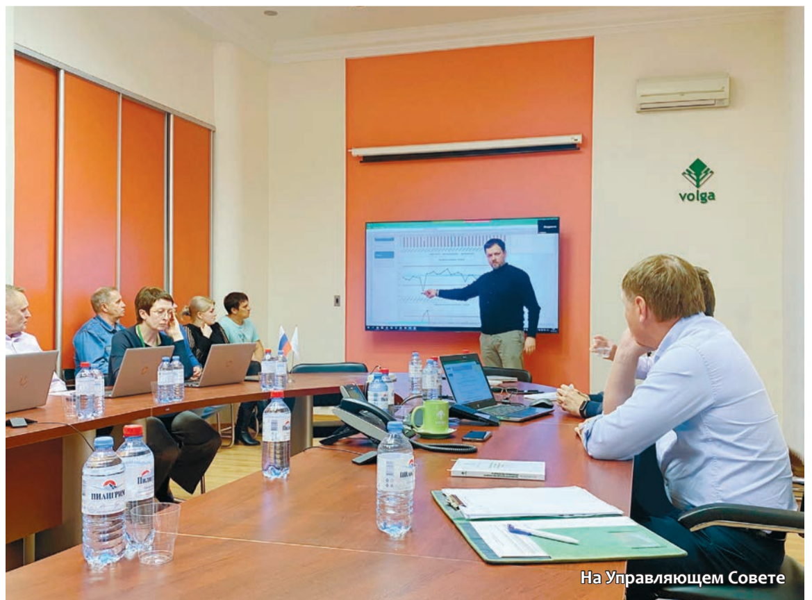
На Управляющем Совете

Завершая встречу, генеральный директор поблагодарил всех докладчиков и отметил, как важно быть заинтересованным, вовлеченным в проект и выразил пожелание, чтобы на следующем Совете спикерами выступали Чемпионы групп проекта «Надежность».