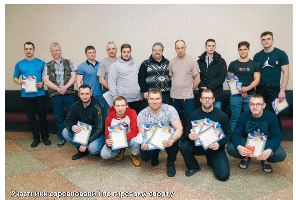
Участники соревнований по гиревому спорту