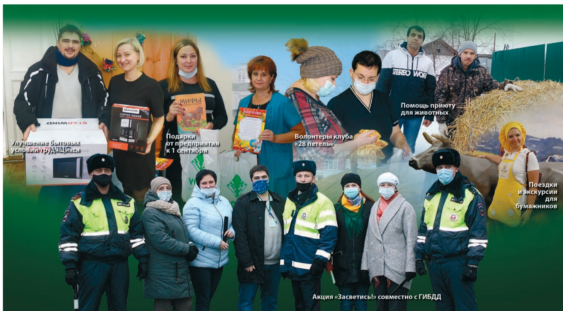
Улучшение бытовых условий трудящихся