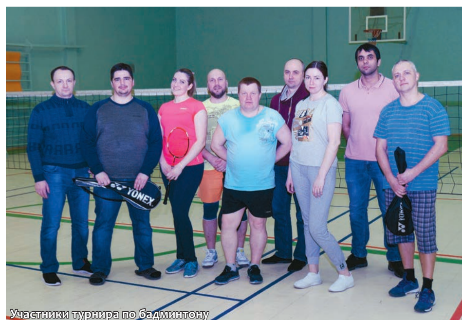
Участники турнира по бадминтону