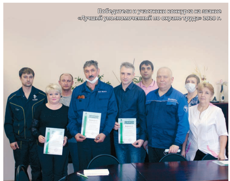
Победители и участники конкурса на звание «Лучший уполномоченный по охране труда» 2020 г.