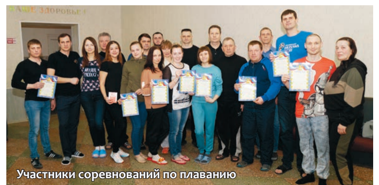
Участники соревнований по плаванию