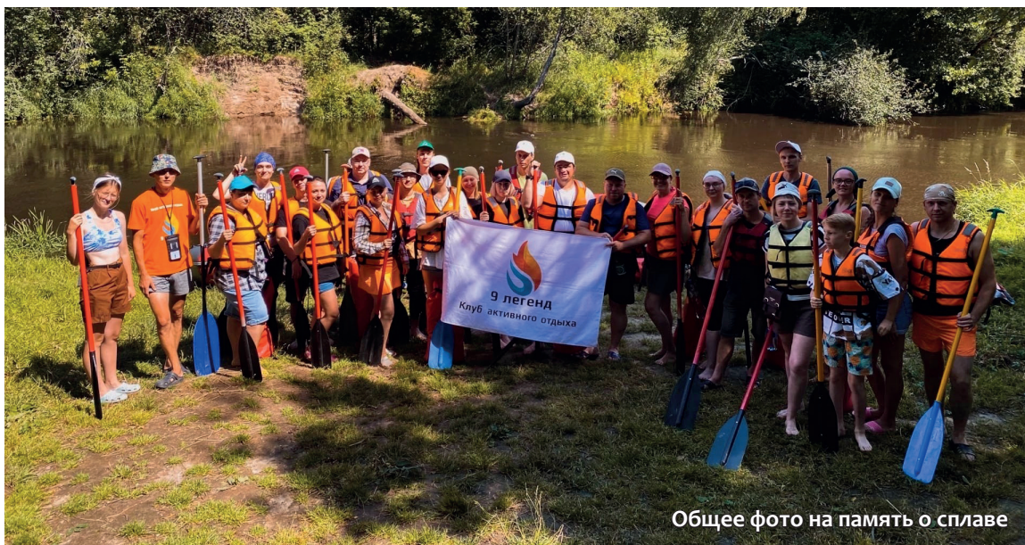
Общее фото на память о сплаве

Испытать свою силу и выносливость удалось каждому.