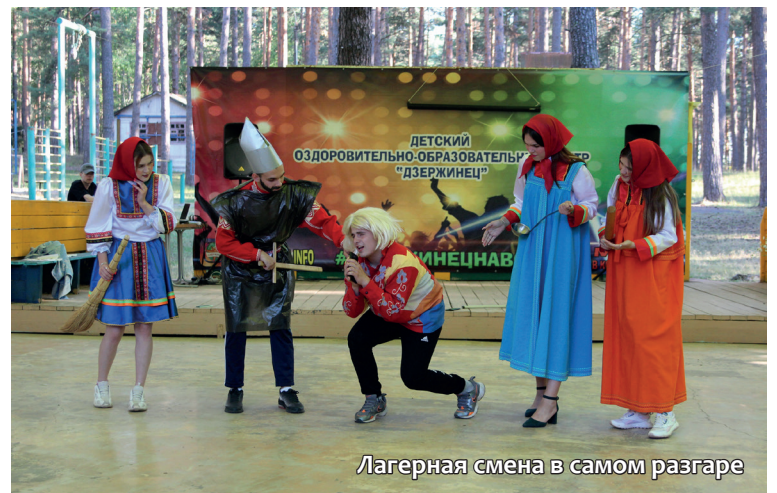
Лагерная смена в самом разгаре

Помимо тематических игр и квестов «Держинец» сохранил традиции в проведении всеми любимых ежегодных лагерных мероприятий и соревнований.