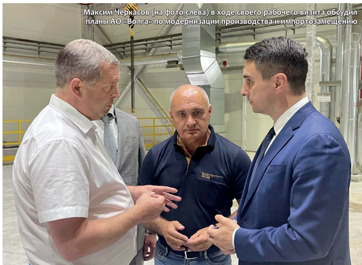
Максим Черкасов (на фото слева) в ходе своего рабочего визита обсудил планы АО «Волга» по модернизации производства и импортозамещению

Первого августа Балахнинский бумкомбинат «Волга» с рабочим визитом с целью обсуждения государственных мер поддержки промышленных предприятий и импортозамещения посетил министр промышленности, торговли и предпринимательства Нижегородской области Максим Черкасов.