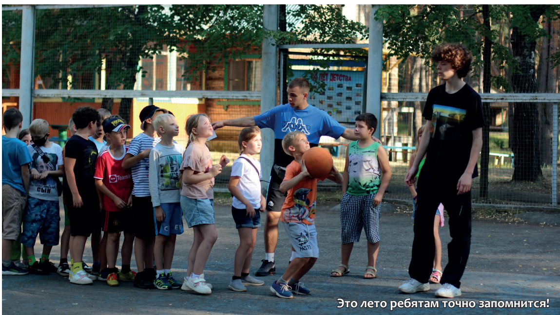
Это лето ребятам точно запомнится!

В сентябре начинается прием заявок на летнюю оздоровительную кампанию 2023 года. Родительский взнос составляет 10% от стоимости путевки, оставшаяся сумма оплачивается предприятием. Если вы желаете приобрести путевку в детский лагерь для своего ребенка, обращайтесь по номеру телефона 9-34-89 (Татьяна).