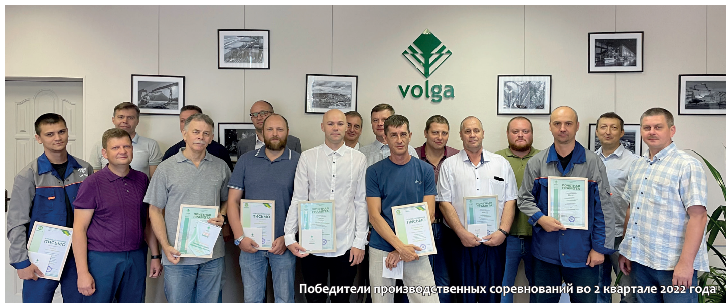
Победители производственных соревнований во 2 квартале 2022 года