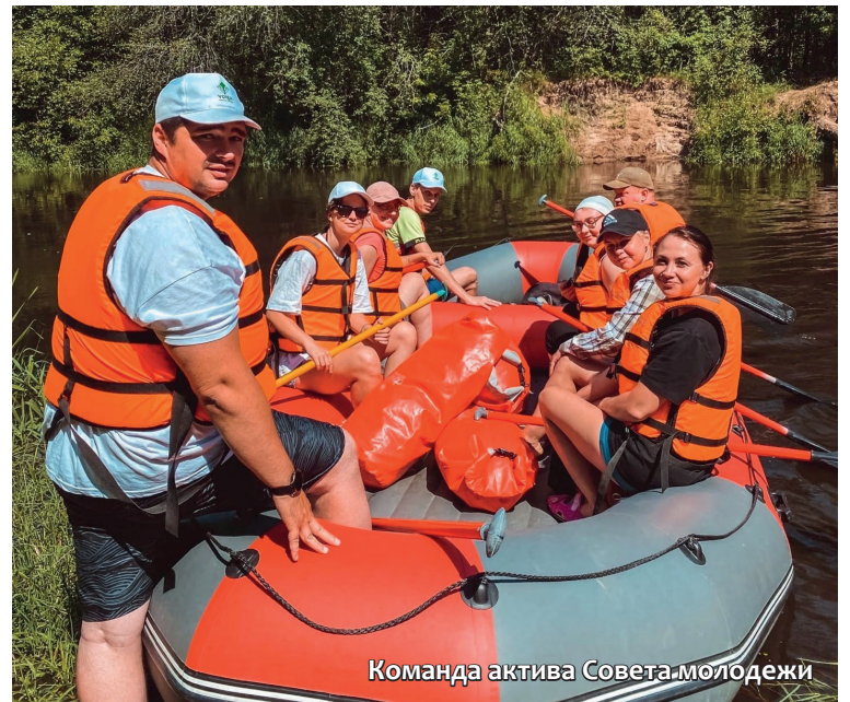
Команда актива Совета молодежи

Около двух часов наперегонки с другими участниками сплава активисты Совета молодежи плыли к остановочному пункту вниз по реке, наблюдая живописные пейзажи многовекового леса.