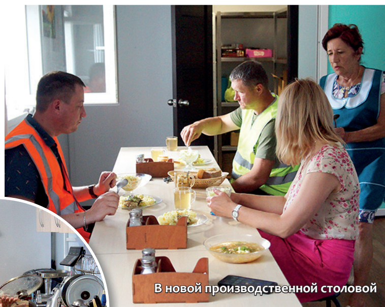
В новой производственной столовой