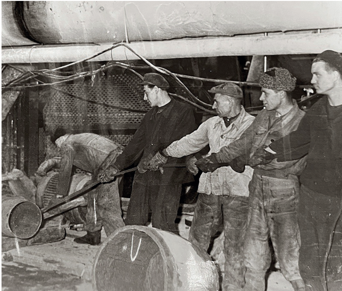
Мы продолжаем публиковать серию ретро фотографий с этапа реконструкции бумагоделательной машины №2. На этом снимке работники БЦБК проводят подготовительные работы для монтажа трубопровода буммашины. 1965 год.